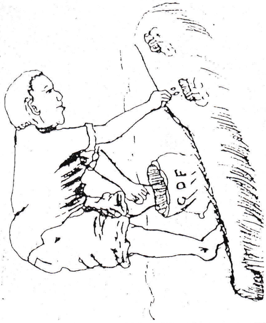
Panda mbegu zilizochanganywa na dawa