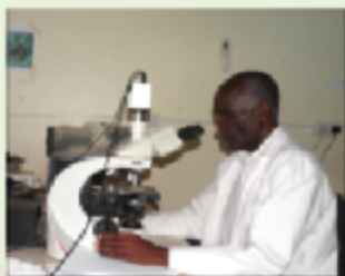
Uchunguzi wa minyoo