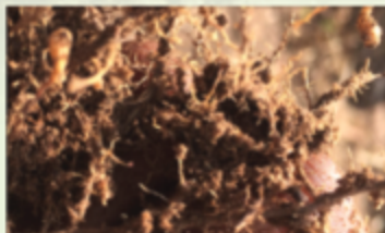
Dalili za minyoo fundu kwenye mizizi (Meloïdogyome)