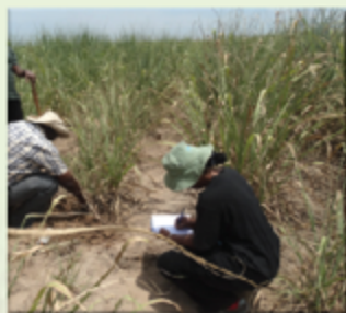
Jinsi ya kuchukua sampuli