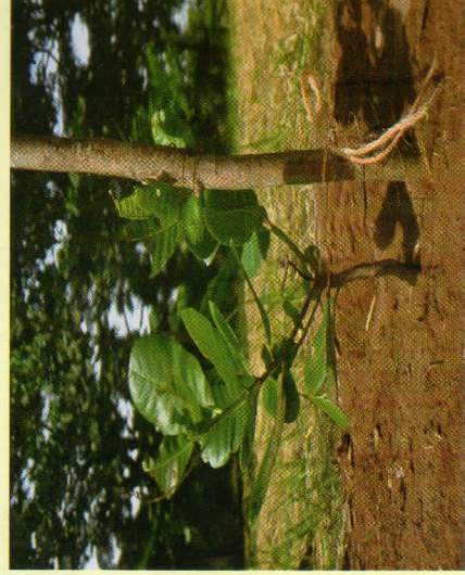
Jinsi ya kuweka mambo kwenye wa mche wa mkorosho.