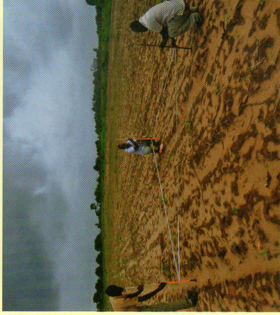
Jinsi ya kupima shamba la korosho