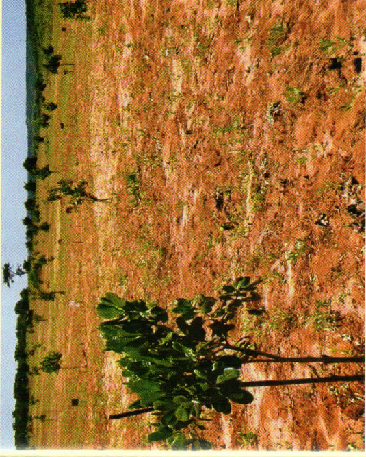
Mfano wa shamba la korosho jipya lililochanganywa na kunde