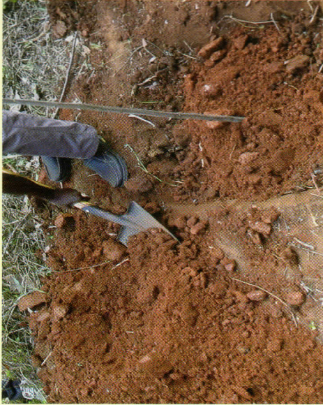
Kurudishia udongo shimoni.