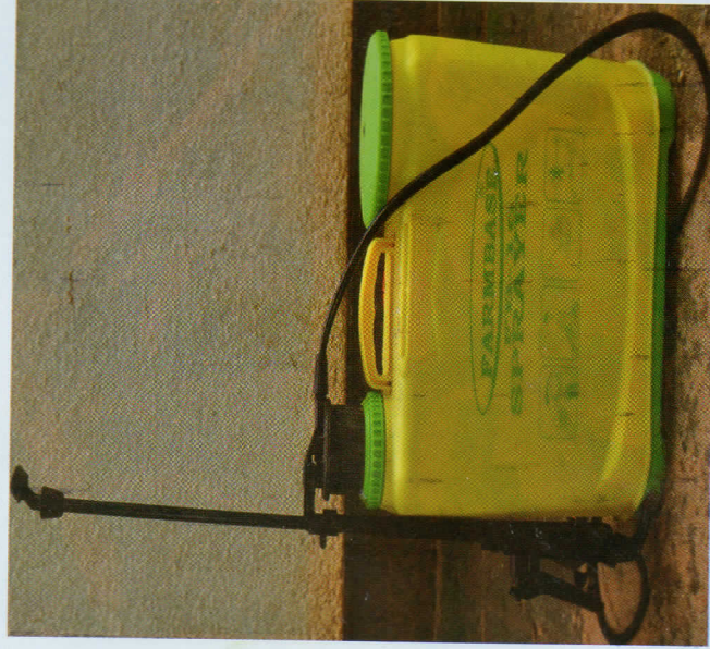
Bomba la mkono linalotumika kunyunyiza viugugu