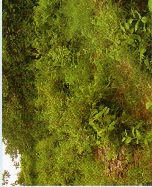
Mfano wa nyasi na Magugu jamii ya vichaka