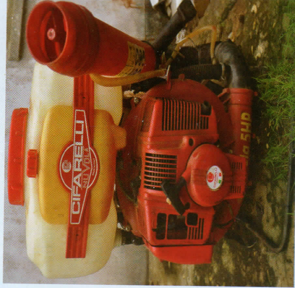
Mashine ya kupulizia mikorosho