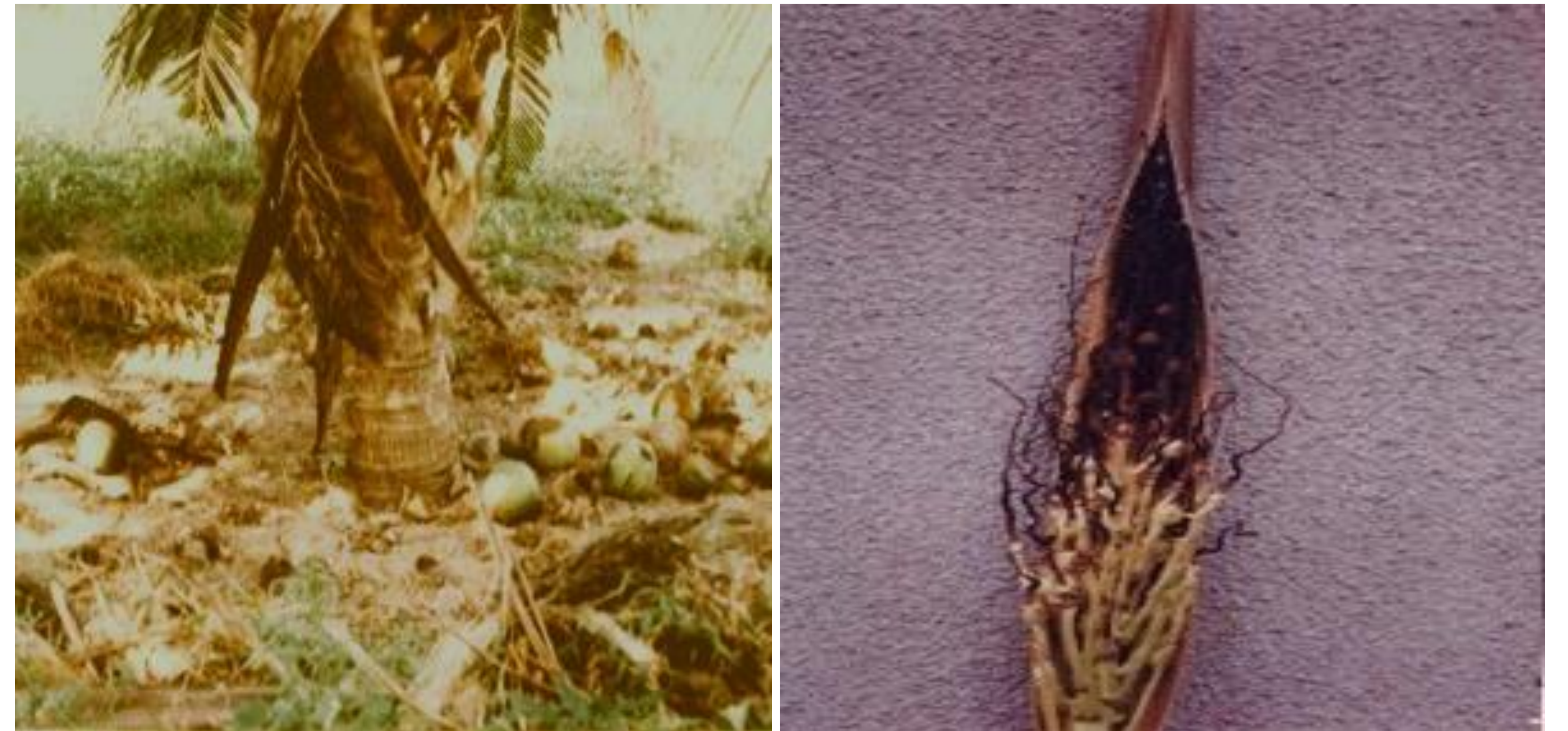
Picha 5: Kuanguka kwa vidaka (a) kole kuwa jeusi (b)