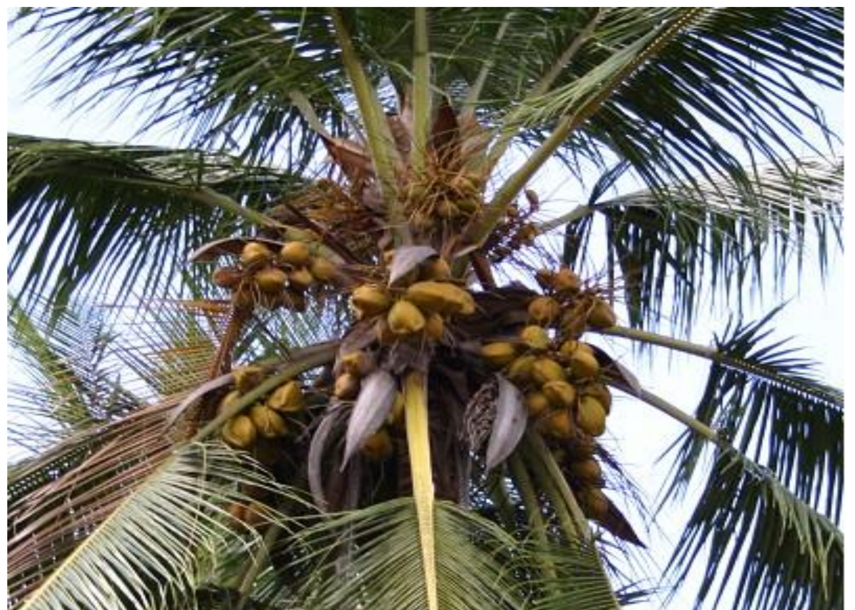
Picha 6: Mnazi uliotunzwa huzaa vizuri