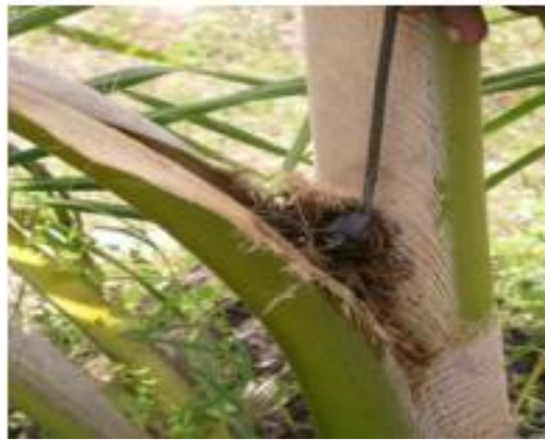
Picha 2: kuondoa chonga kwa kutumia ndoano