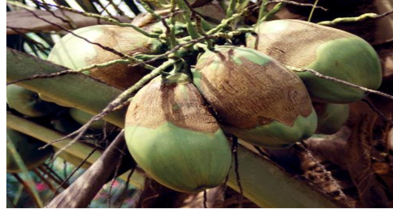
Picha 4: Athari za utitiri wa nazi

Utitiri wa minazi ni wadudu ambao hupunguza ubora wa nazi kwa kufyonza maji kwenye vidaka na husababisha nazi kusinyaa (Picha 4) na hatimaye nazi kuwa na ganda gumu kutopanuka na kuwa nazi ndogo.