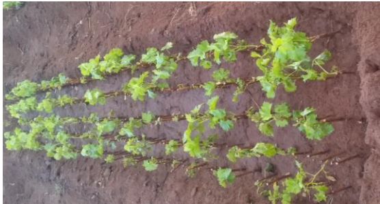
Makatwa yaliyopandwa kitaluni