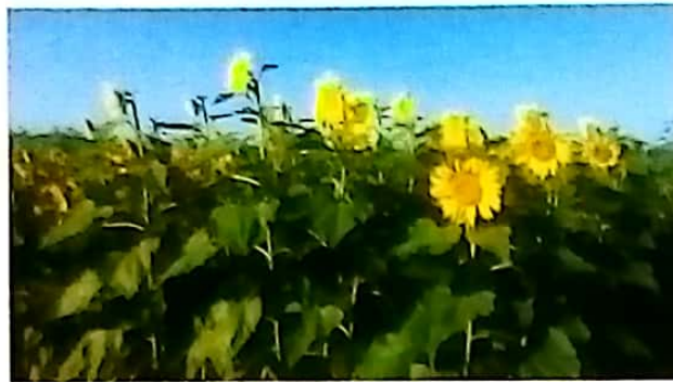
Shamba la mbegu ya Record TARI Ilonga