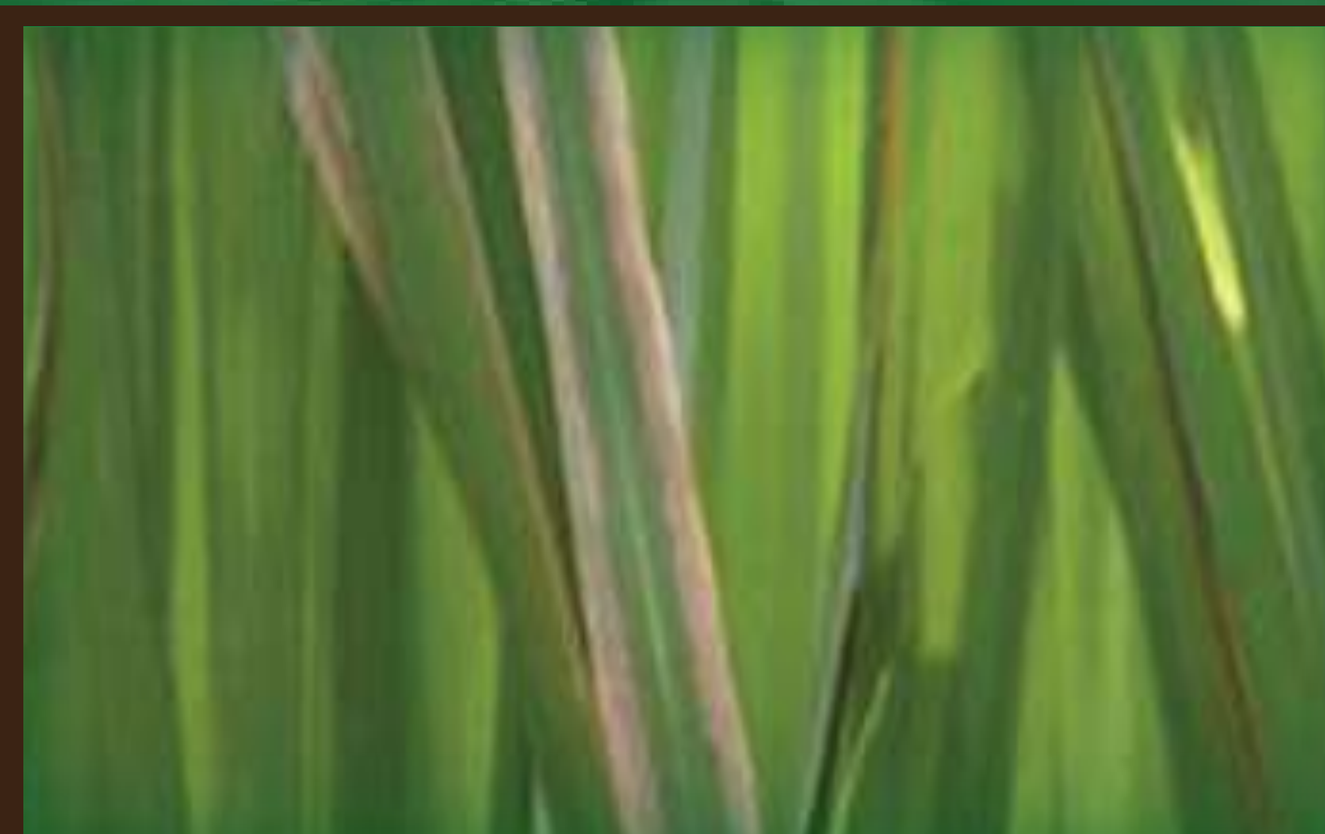
Mnyauko wa majani wa Bakteria (Bacterial Leaf Blight)