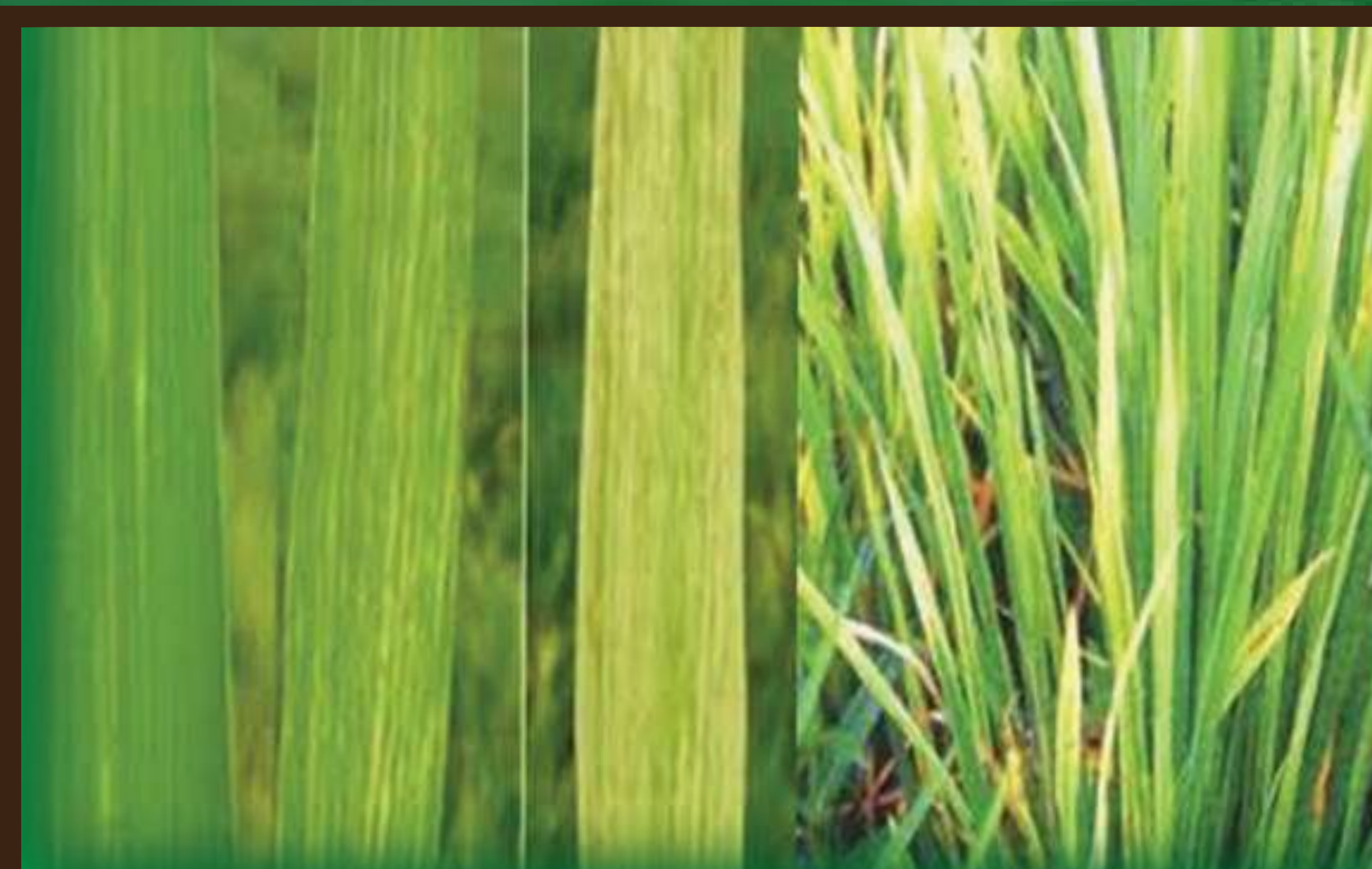
Kimyanga (Rice Yellow Mottle Virus Disease)