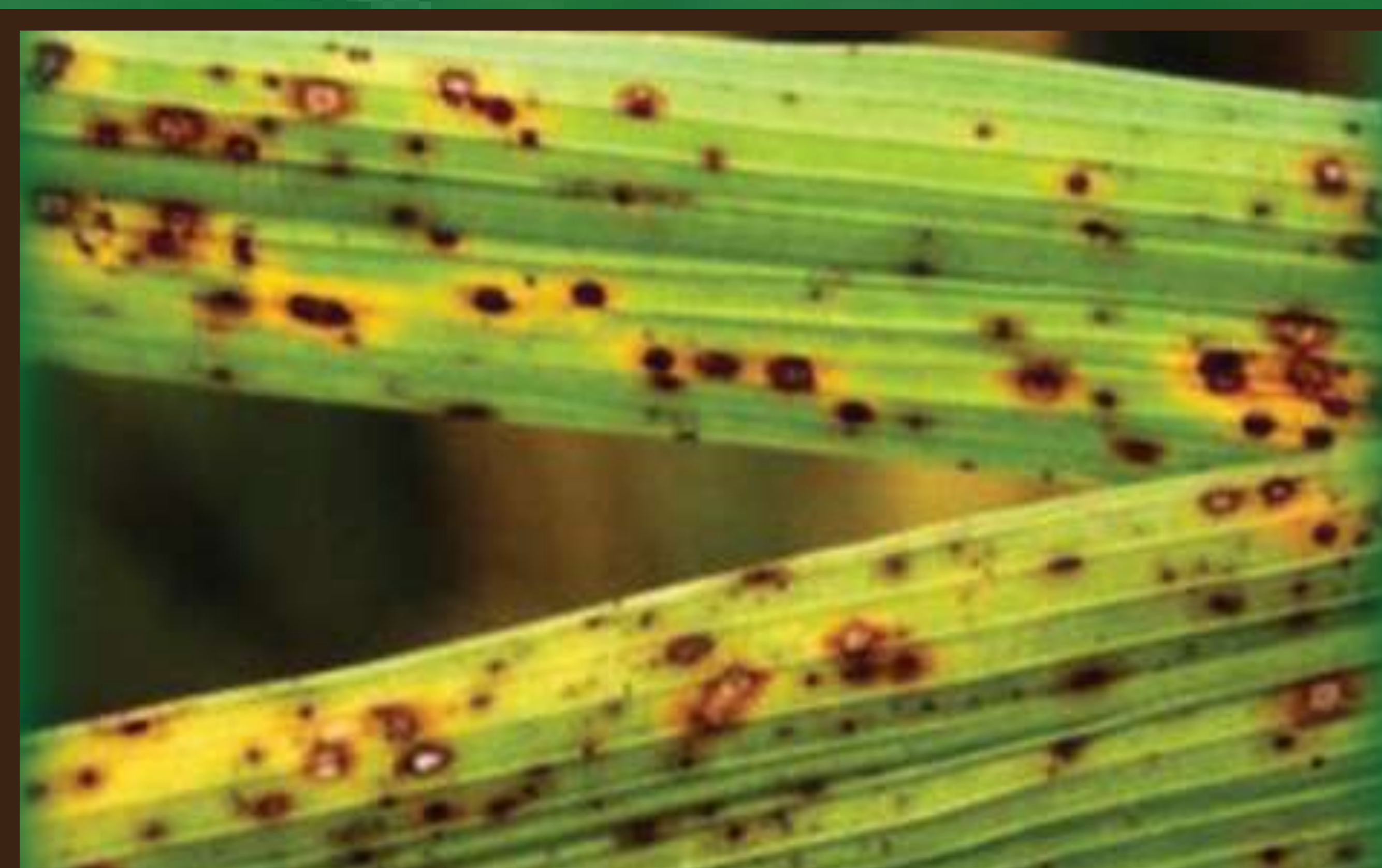
Baka kahawia (Rice Brown Spot)