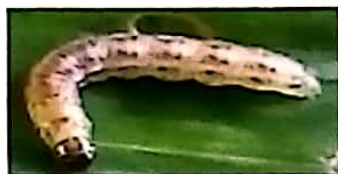
Funza wa mabua

kuvuna mazao shambani ili kupunguza mashambulizi ya Inzi wa kikonyo na funza wa mabua.