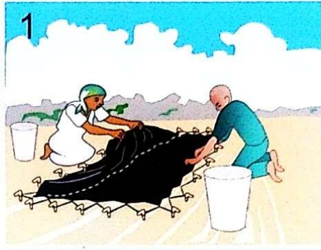
Fungua zipu ya CDC