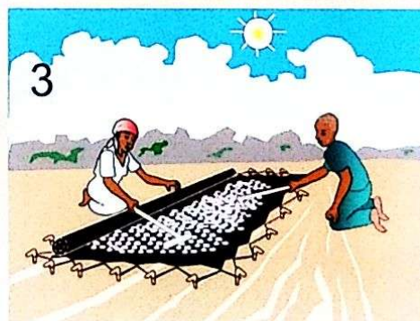
Sambaza vyema mahindi kwa urefu wa sentimita 4 za kamba