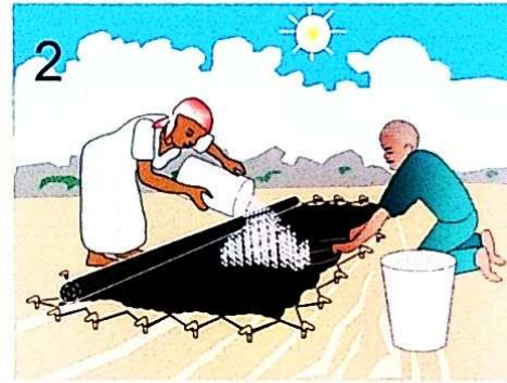
Kisha mimina mahindi taratibu